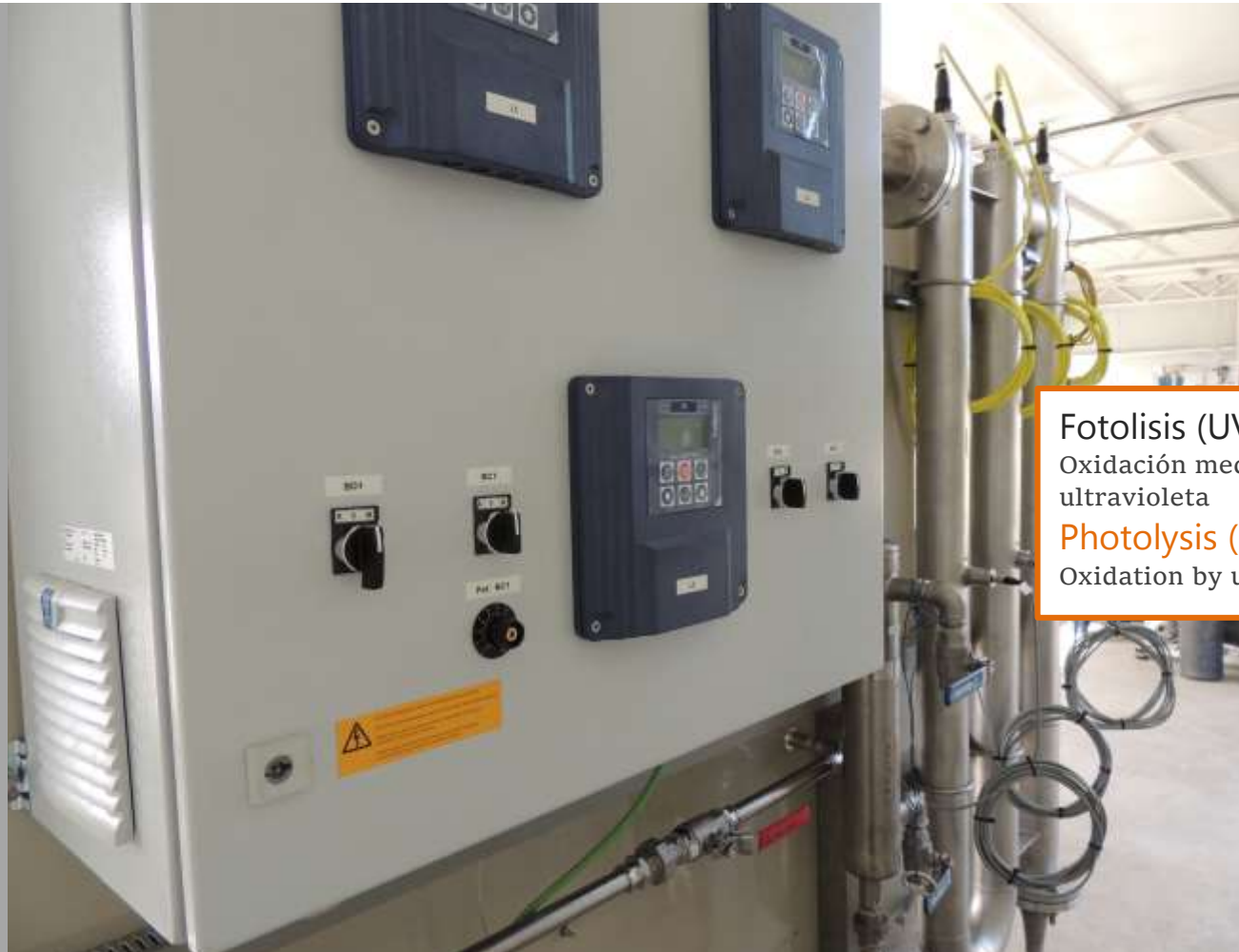
Fotólisis (UV) Oxidación mediante luz ultravioleta Photolysis (UV) Oxidation by ultraviolet light