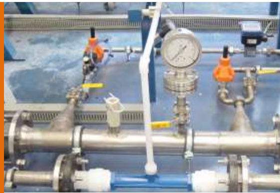
Procesos de Oxidación Avanzada Generación de radicales hidroxilo Advanced Oxidation Processes Generating hydroxyl radicals