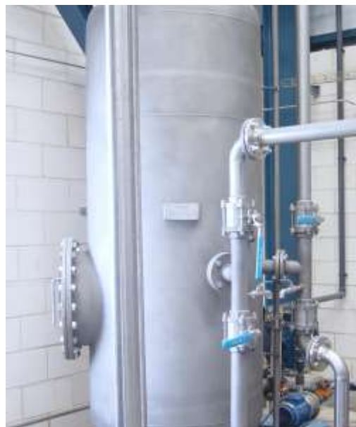
Oxidación catalítica (Procesos de oxidación avanzada) Generación de radicales hidroxilo mediante catálisis homogénea y heterogénea Catalytic oxidation (Advanced oxidation Processes) Hydroxyl radical generation by homogeneous and heterogeneous catalysis