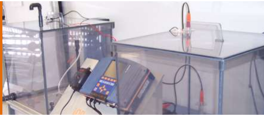
Celdas de Combustible Microbianas CCM Generación de energía a partir de agua residual Microbial Fuel cells MFC Generating energy from wastewater